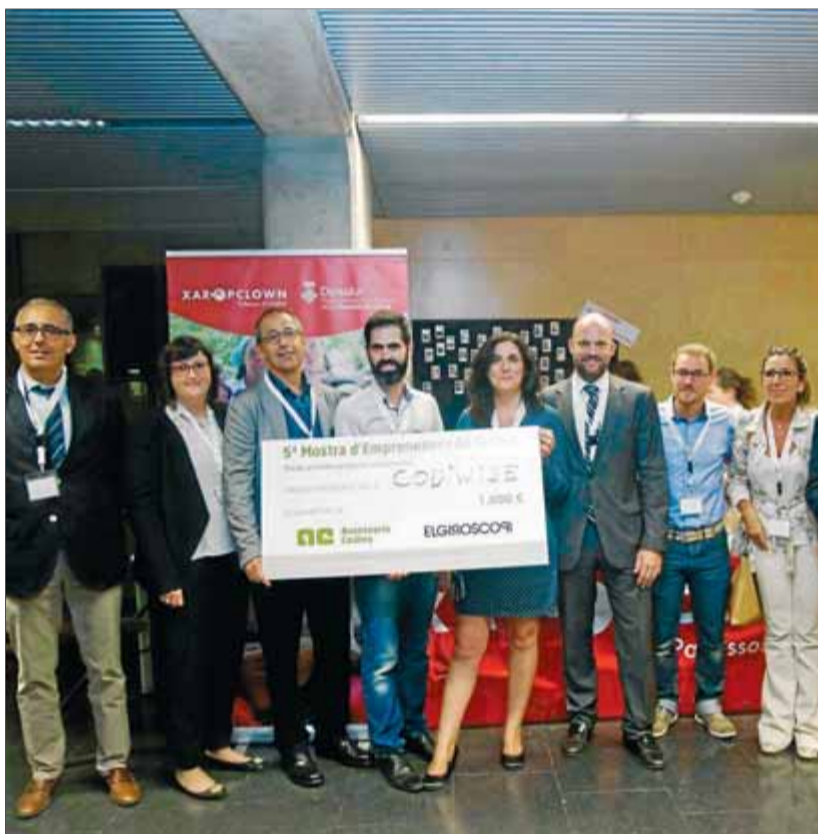
Membres de l'empresa Codiwise que va guanyar la Mostra d'Emprenedors de Girona, acompanyats de membres del jurat